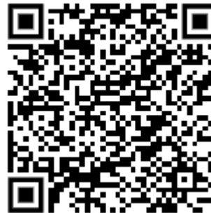
KMK: „Standards für die Lehrerbildung“